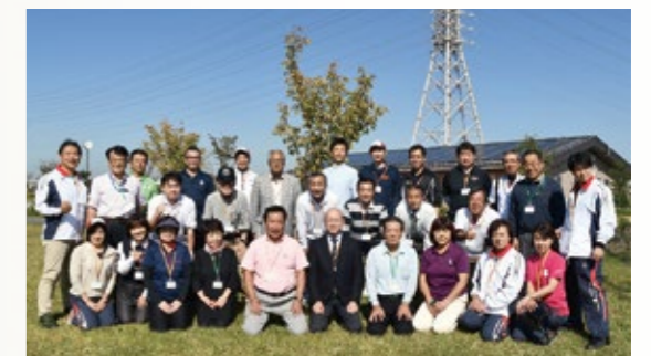
▲パークゴルフで親交を深めました

また、併せて行った両市町の現状や課題についての意見交換会などを通して、より一層、親交を深めることができました。