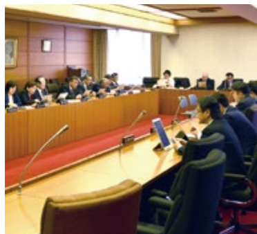
▲全員協議会での検証の様子