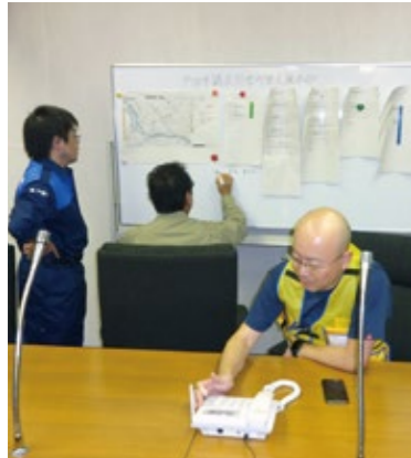
▲市役所6階に設置された支援本部

台風第19号の接近に伴い、戸田市議会では、「戸田市議会災害対策支援本部」を設置し、災害対応に当たりました。これは、平成26年制定の「戸田市議会における災害発生時の対応要領」に基づくものであり、今回が初めての設置となります。11月11日には、全員協議会を開催し、執行部より、被害状況の報告を受けるとともに、今回の災害対応について、検証を行いました。概要は以下のとおりです。