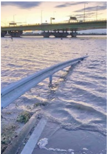
▲議員が撮影した彩湖・道満グリーンパークの様子